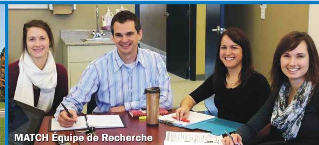
MATCH Équipe de Recherche