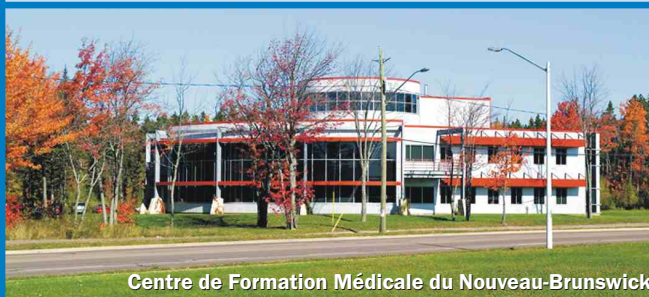
Centre de Formation Médicale du Nouveau-Brunswick

www.nbhrf.com/fr/chercheur-en-sante-mois-nb